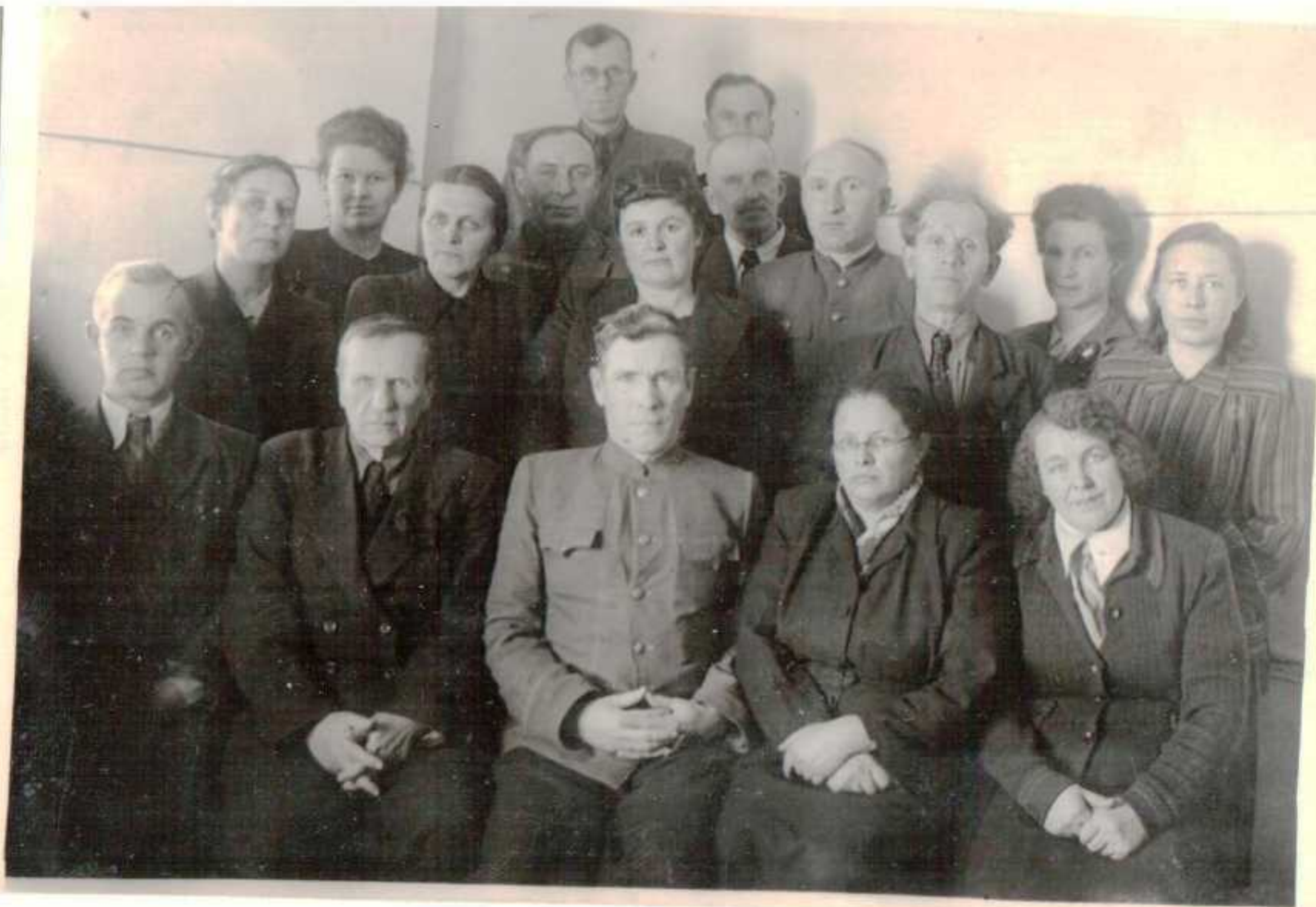
Педагогический коллектив техникума.