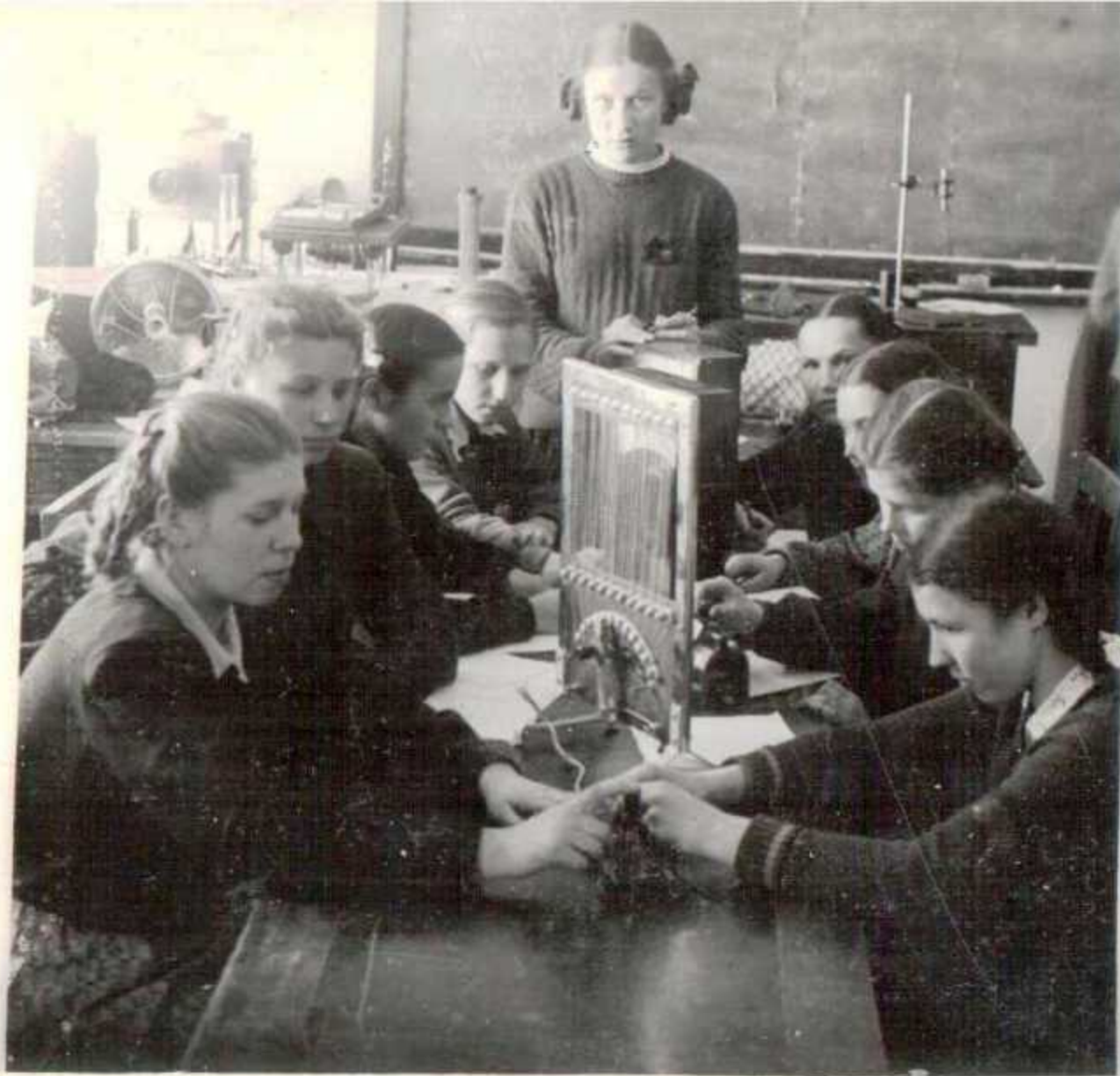
В физическом кабинете Т к.