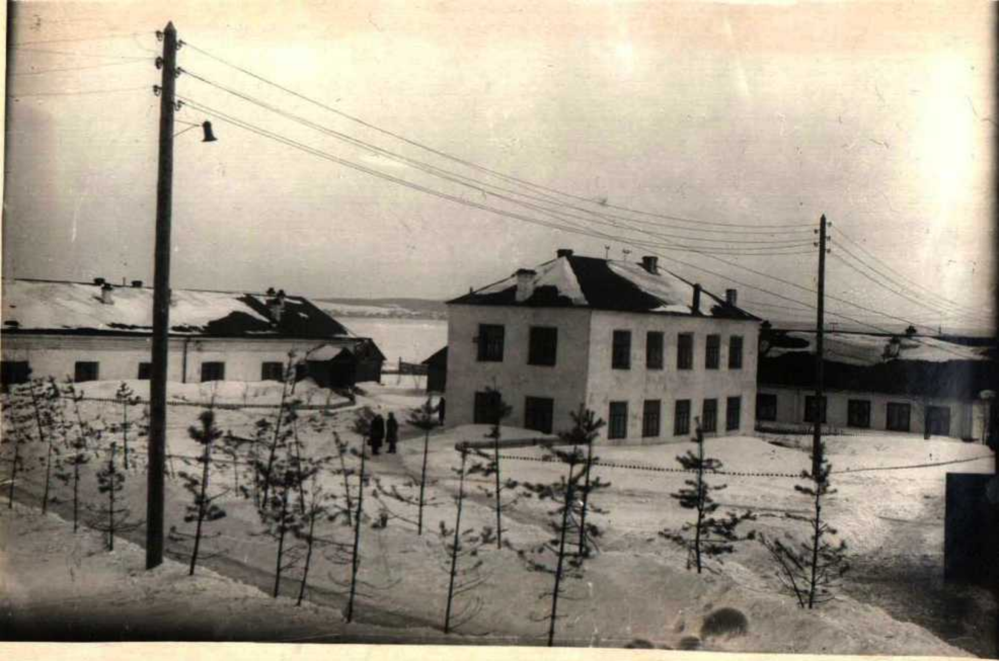
Учебный корпус, лаборатории, общежития.