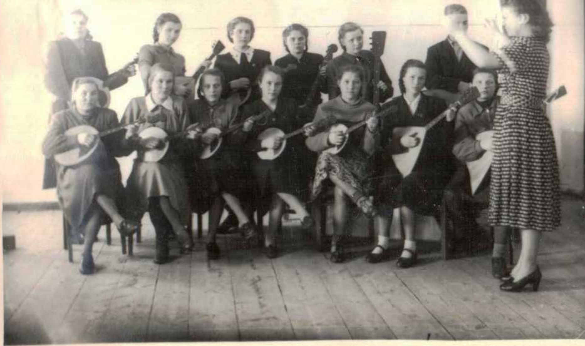
Долмро - балалаечный оркестр.