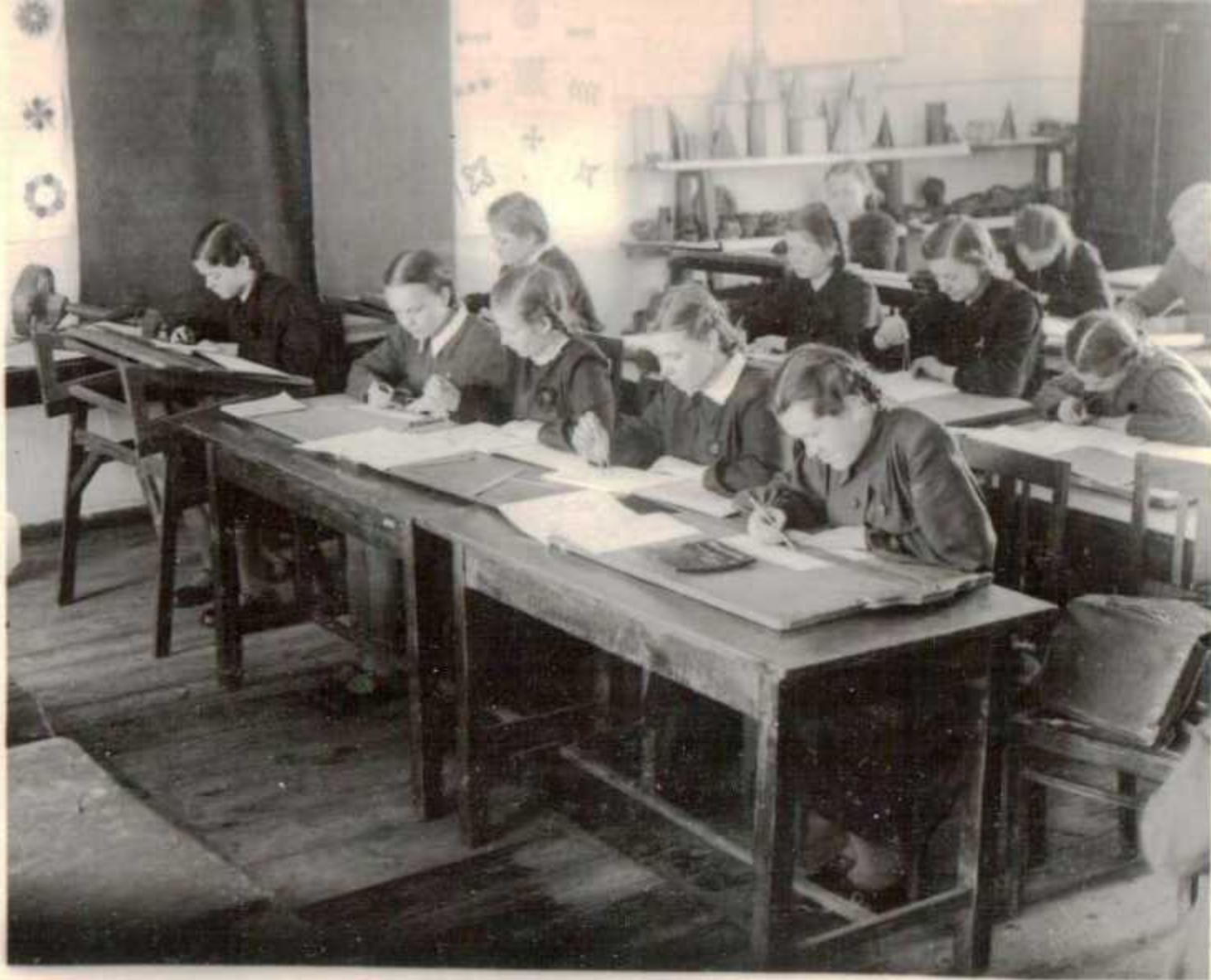
... D D D Урок черчения I к.