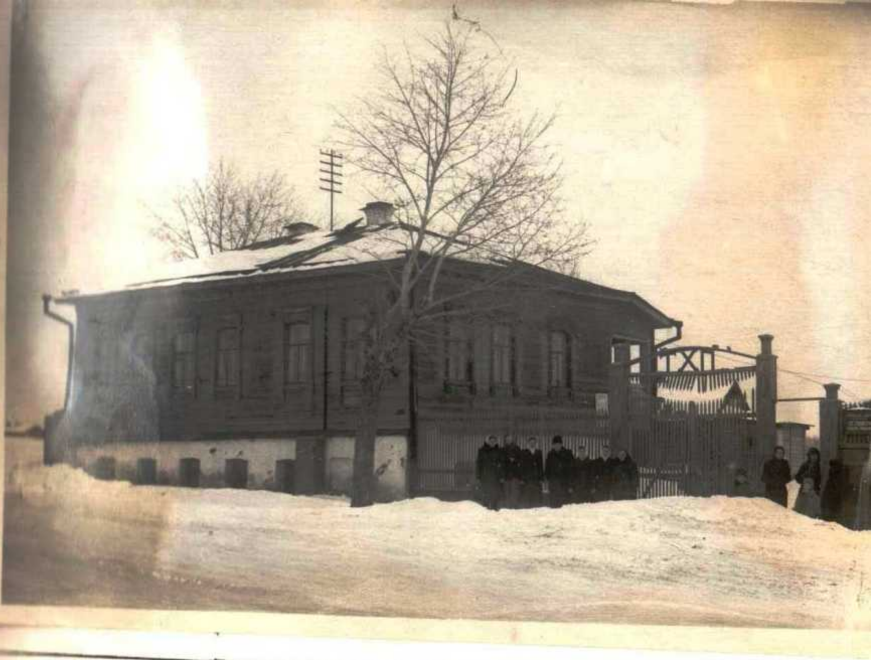
Библиотека и канцелярия