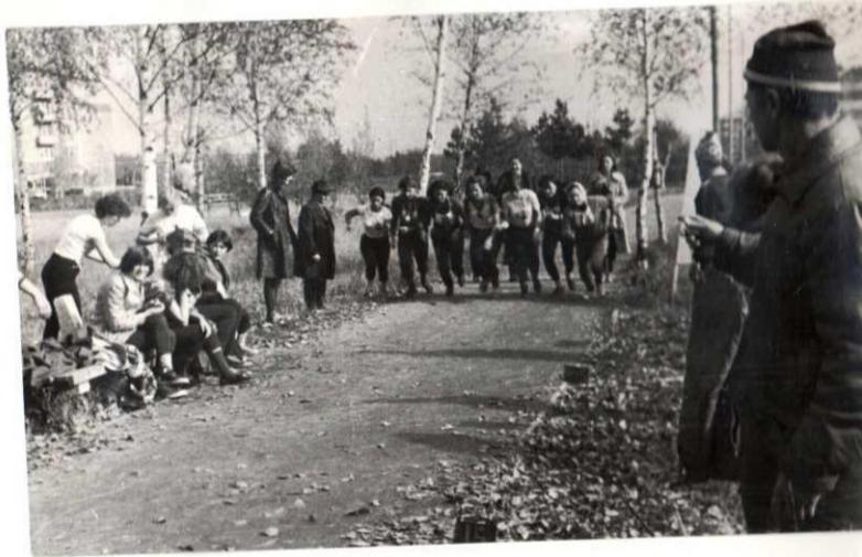
КОМСОМОЛЫЦЫ ТЕХНИКУМЯ УСПЕШНО СДЯЮТ НОРМЫ НЯ ЗНАЧОК ГПО