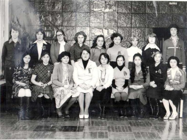
КОМИТЕТ ВЛКСМ НА 45-й РАЙОННОЙ