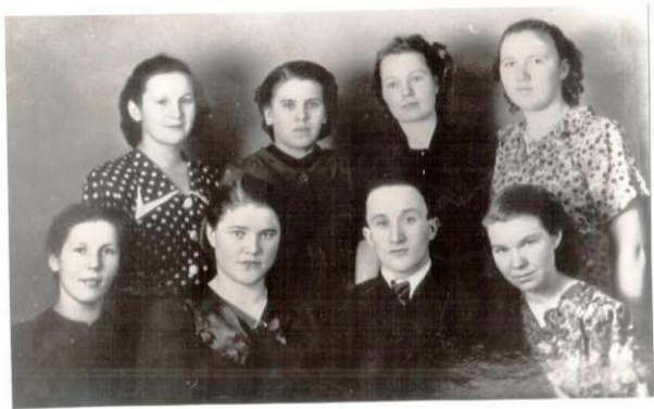
Комитет комсомола 1953 года.